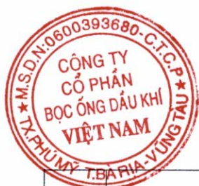
Bảng 1. Danh sách người có liên quan của Công ty. (Đính kèm Báo cáo tình hình quản trị năm 2022)