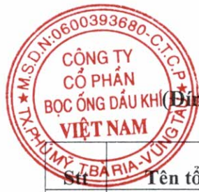
Bảng 1. Danh sách người có liên quan của Công ty. (Đính kèm Báo cáo tình hình quản trị Công ty 6 tháng năm 2023)