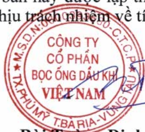
Bùi Tương Định

Phiên họp Đại hội đồng cổ đông thường niên năm 2025 của Công ty Cổ phần Bọc ống Dầu khí Việt Nam đã kết thúc vào hồi 17 giờ 00 phút, ngày 11/04/2025, Biên bản này được lập thành 2 bản chính, Chủ tọa Phiên họp và Thư ký cùng liên đới chịu trách nhiệm về tính trung thực, chính xác của nội dung Biên bản này.