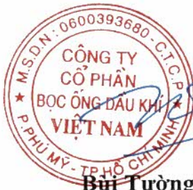
Bùi Tường Định

Phiên họp Đại hội đồng cổ đông thường niên năm 2026 của Công ty Cổ phần Bọc ống Dầu khí Việt Nam đã kết thúc vào hồi 17 giờ 00 phút, ngày 18/06/2026, Biên bản này được lập thành 2 bản chính.